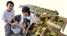
手作りの道具「カリカリ君」で種を取る子どもたち