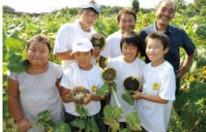
地元の方や子どもたちと一緒に楽しくひまわりの収穫