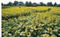
ひまわりは座間市の花。市内には、広大なひまわり畑が点在し、開花時期には観光客で賑わいます。